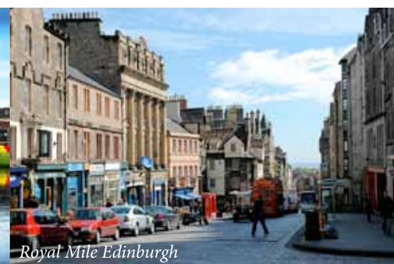
Royal Mile Edinburgh